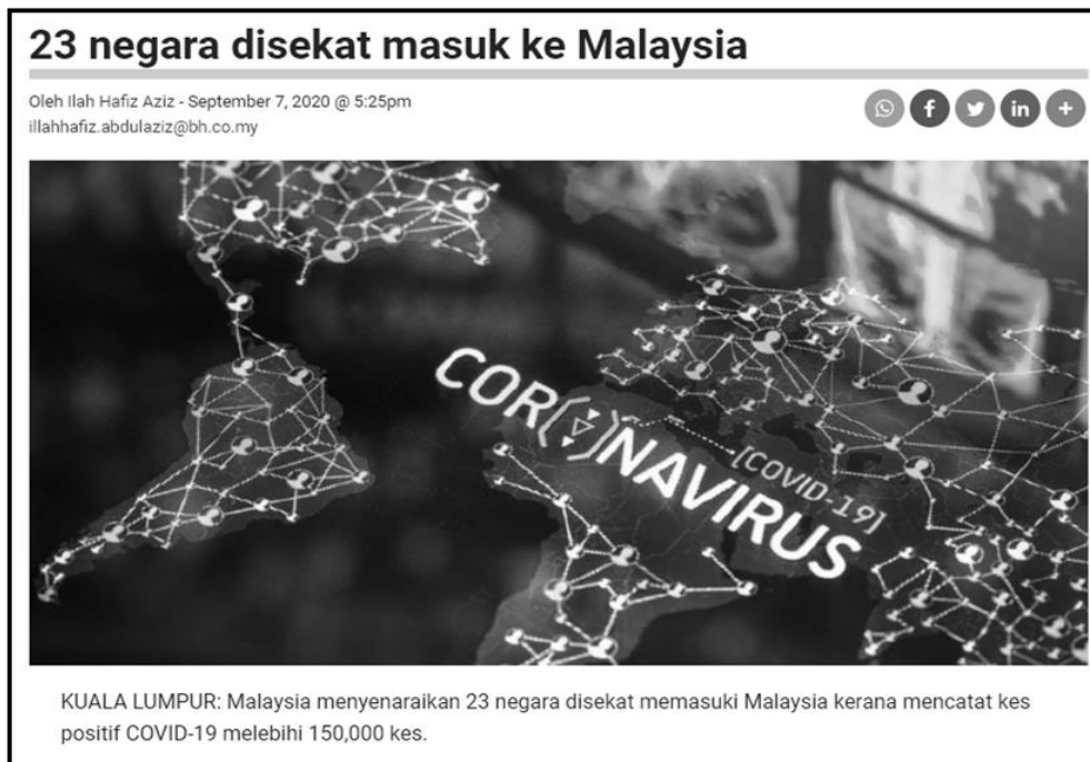
Sumber : Berita Harian, 7 September 2020

9. Maklumat berikut berkaitan kesan pandemik Novel Coronavirus (COVID-19).